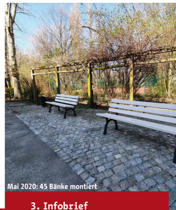
Mai 2020: 45 Bänke montiert