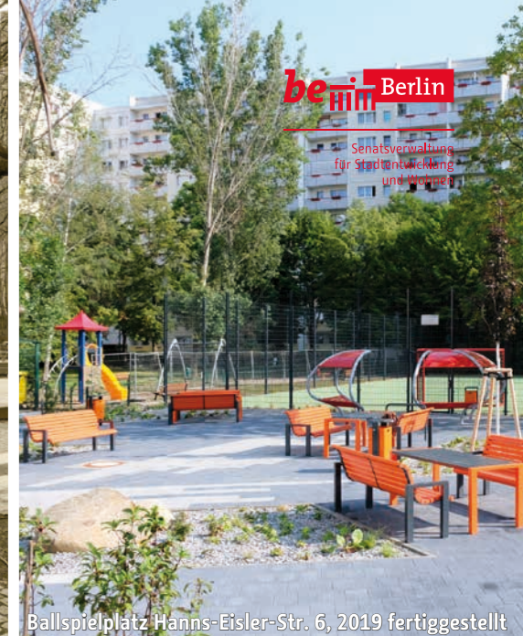
Ballspielplatz Hanns-Eisler-Str. 6, 2019 fertiggestellt