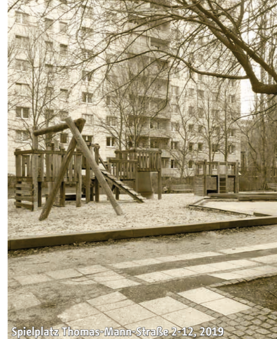
Spielplatz Thomas-Mann-Straße 2-12, 2019