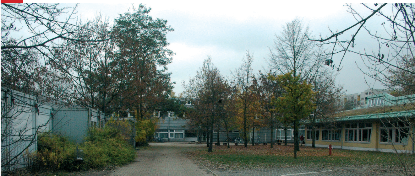
Haupteingang mit Vorplatz