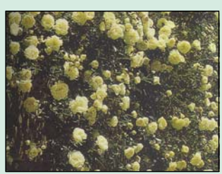
Pflanzen- und Materialauswahl