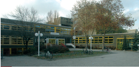
Haupteingang mit Vorplatz