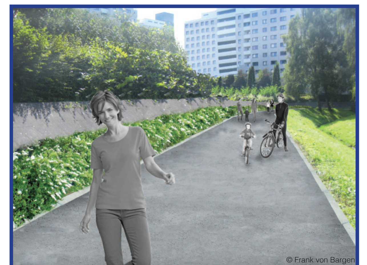
Planungsskizze, Zustand nach dem Umbau