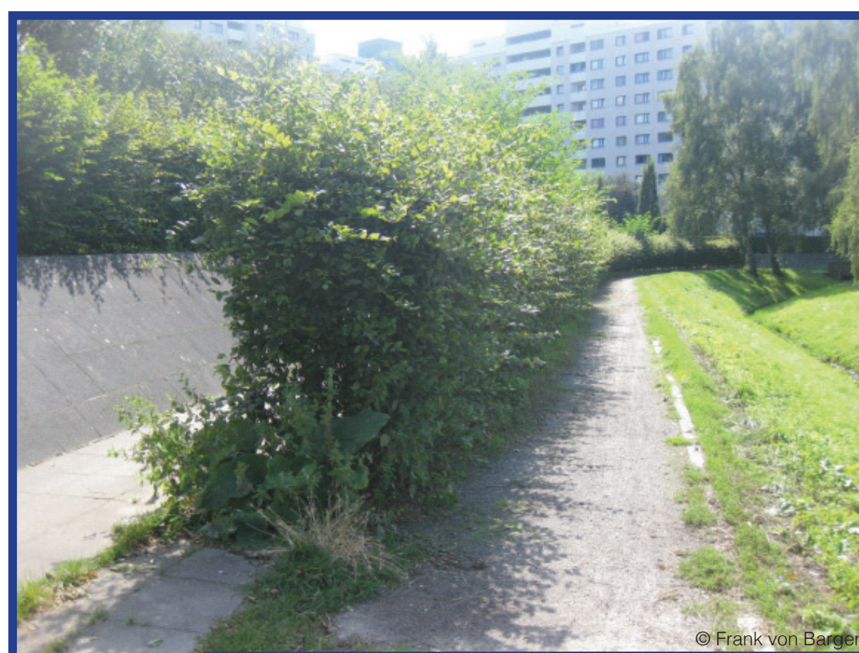
Bestand am Fasaneriegraben an der Quickborner Straße