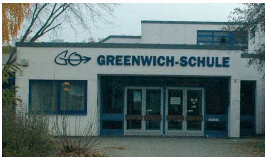
Haupteingang mit Vorplatz