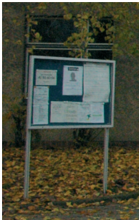
Haupteingang mit Vorplatz