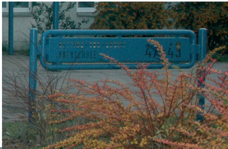
Haupteingang mit Vorplatz