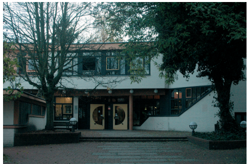
Haupteingang mit Vorplatz