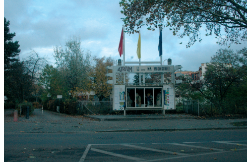
Ansicht Senftenberger Ring