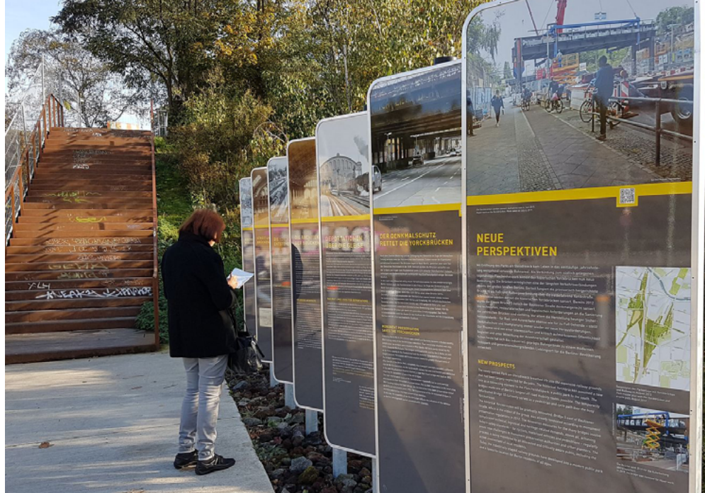
Der Informationsort ist Teil des Geschichtsparcours Yorckbrücken.