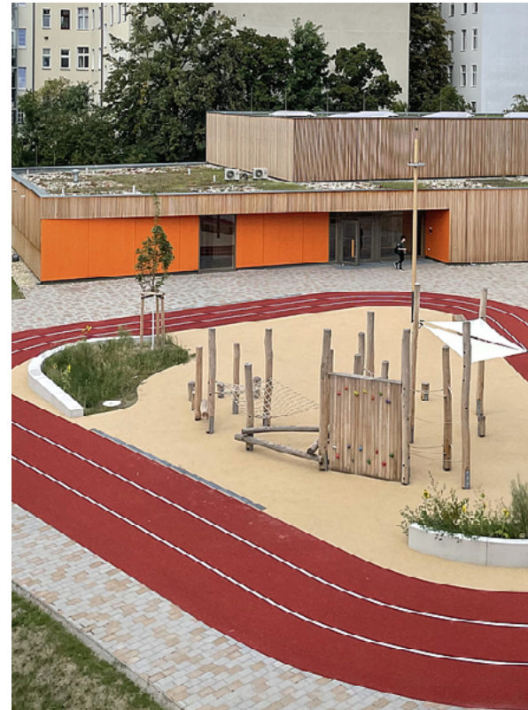
Neubau von Sporthalle, Laufbahn und Bewegungsparcours für die Johannes-Schule

Eine wichtige Aufgabe im Gebiet Schöneberg Südkreuz ist die bessere Vernetzung der einzelnen Ortsteile in dem von Bahnlinien zerschnittenen Gebiet. Diesem Zweck dient nicht zuletzt der neue Ost-West-Grünzug für Fußgänger, Radler und Skater von Neu-Tempelhof über die Schöneberger Insel bis zur Ebersstraße. Er verbindet die Ortsteile Tempelhof und Schöneberg, auch mithilfe einer neuen Fußgänger- und Radfahrerbrücke, dem Alfred-Lion-Steg.