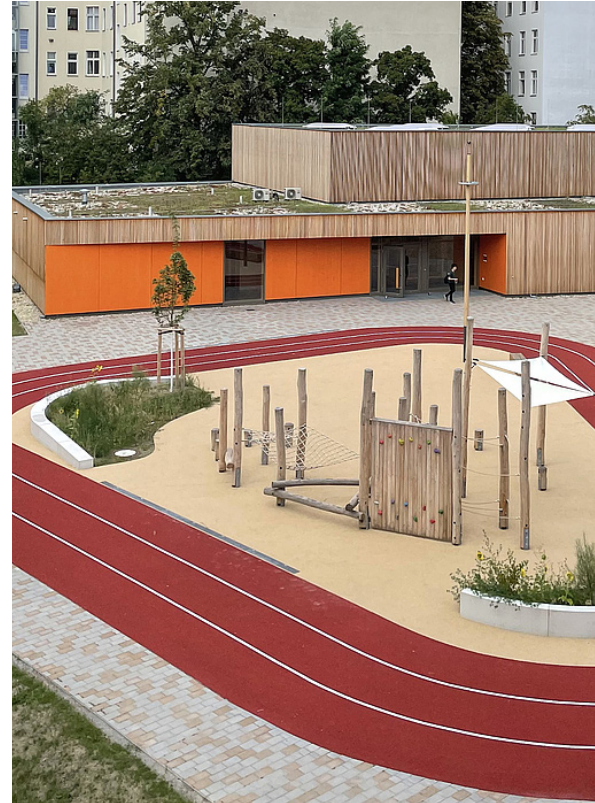
Neubau von Sporthalle, Laufbahn und Bewegungsparcours für die Johannes-Schule

Eine wichtige Aufgabe im Gebiet Schöneberg Südkreuz ist die bessere Vernetzung der einzelnen Ortsteile in dem von Bahnlinien zerschnittenen Gebiet. Diesem Zweck dient nicht zuletzt der neue Ost-West-Grünzug für Fußgänger, Radler und Skater von Neu-Tempelhof über die Schöneberger Insel bis zur Ebersstraße. Er verbindet die Ortsteile Tempelhof und Schöneberg, auch mithilfe einer neuen Fußgänger- und Radfahrerbrücke, dem Alfred-Lion-Steg.