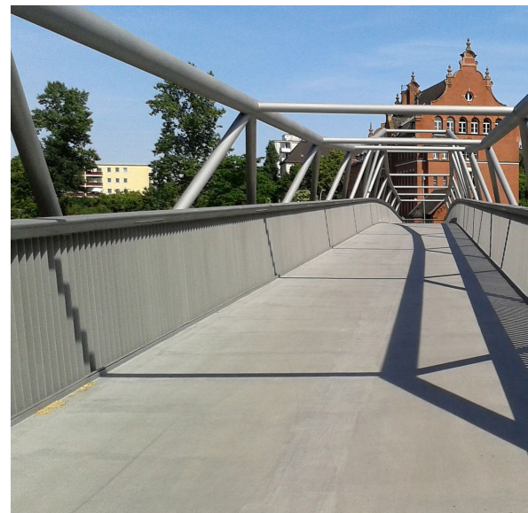
Alfred-Lion-Steg als Teil des Ost-West-Grünzuges