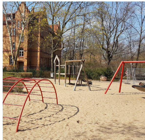
Spielplatz im SportPark Poststadion