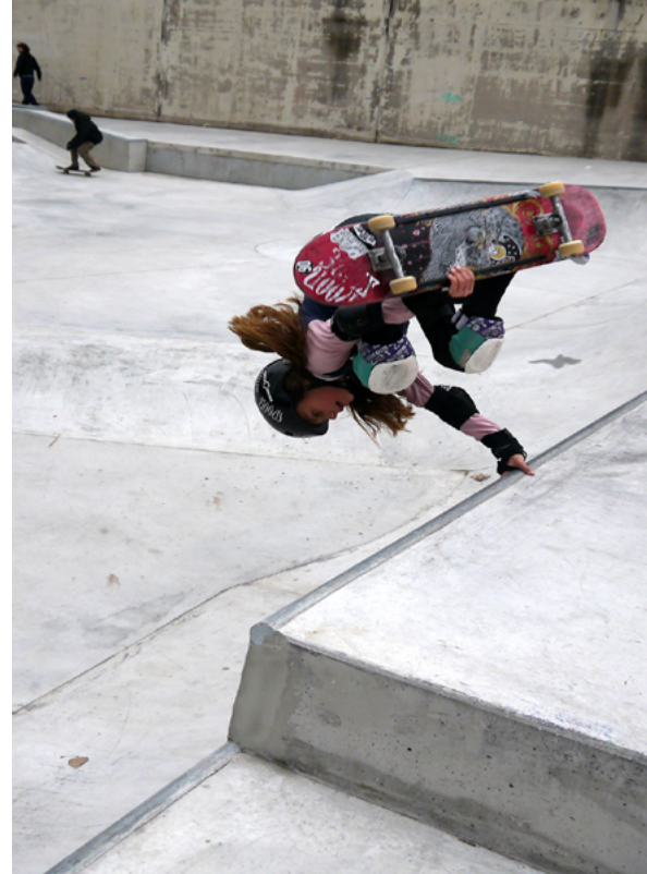
Eröffnung des Skate-Parks

Das Poststadion-Areal mit dem Fritz-Schloß-Park hat im Zuge der Förderung eine Verjüngung, Ergänzung und neue Zukunftsfähigkeit erlangt. Gefördert wurden u.a. die Aufwertung des Tribünengebäude-Umfeldes, die Errichtung eines Minigolfplatzes mit Café, das Informations- und Leitsystem, der Neubau einer Skateanlage und die Döberitzer Grünverbindung zwischen Turmstraße bis zur Lehrter Straße. Im Rahmen des Prozesses konnten die Errichtung eines Kletterzentrums des Deutschen Alpenvereins, der „Botschaft für Kinder“ des SOS-Kinderdorfes und die Einpassung einer privaten Wellness-Anlage unterstützt werden. Das Niederschlagswassermanagement im Park ist eine wichtige Maßnahme der Klimaanpassung. Weiter werden derzeit der Eingangsbereich Lehrter Straße neu gestaltet und eine Kita am Hallenbad geplant. Auch im Umfeld des Fritz-Schloß-Parks wird die soziale und kulturelle Infrastruktur weiterentwickelt, wie die Herrichtung des Außenbeckens im Stadtbad Tiergarten und die Neugestaltung der Schulfreiflächen in der Kruppstraße 14.