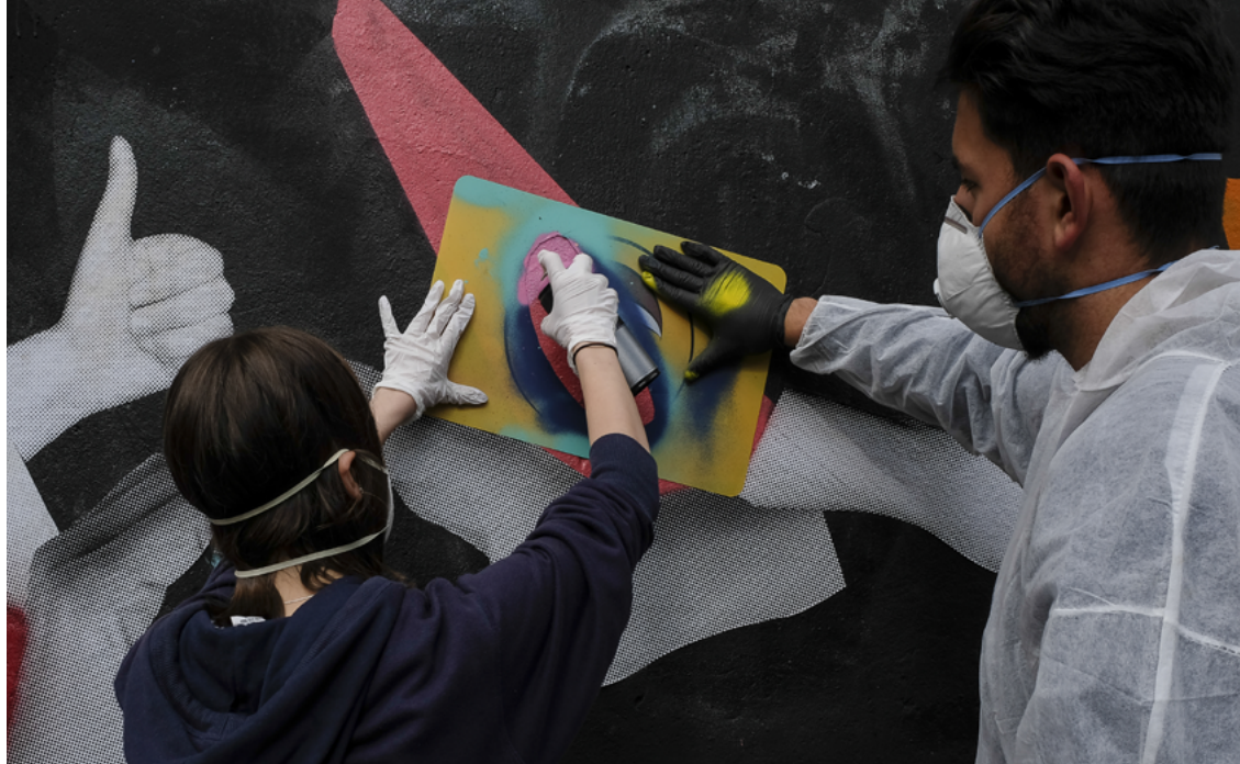
Graffiti-Workshop an der Heinrich von Stephan-Gemeinschaftsschule