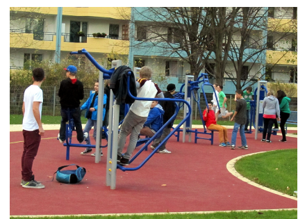
Auch Outdoor-Fitnessgeräte gehören zur neuen Ausstattung