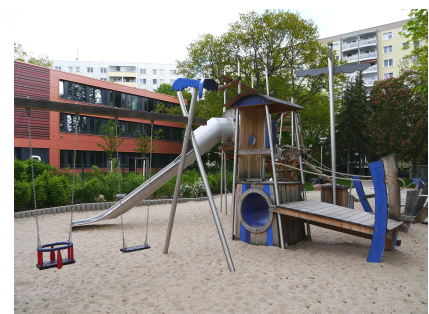
Der kleinere Kletterturm mit Rutsche