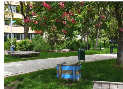
Grünfläche mit zusätzlichen Spielmöglichkeiten