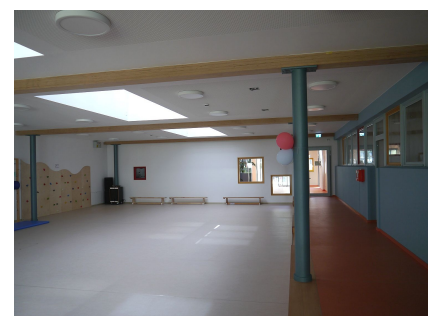
Der geschlossene Innenhof wurde überdacht und als Mehrzweckhalle ausgebaut

Quelle: Buddensieg Ockert Architekten, Fotos u. Bearbeitung: Anka Stahl Stand: April 2024