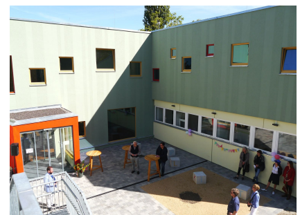
Das neue Verbindungsgebäude und der aufgestockte Teil der Kita