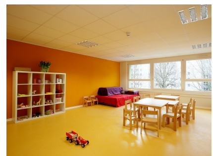
Ein Gruppenraum der neuen Kita