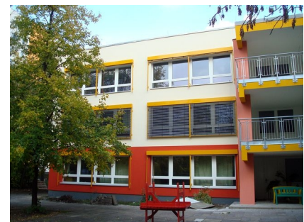
Neue Loggien und außenliegender Sonnenschutz an der Gartenseite