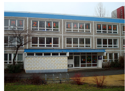
Das Gebäude vor der Sanierung