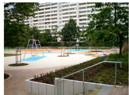
Blick auf den neuen Schulhof