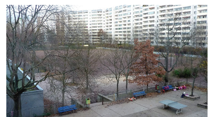
So sah es hier bis 2013 aus