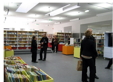
Der Innenraum der Bibliothek