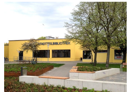
Das Gebäude vom Rosengarten aus gesehen