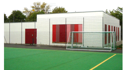
Das Gebäude vom Kunstrasenplatz aus gesehen