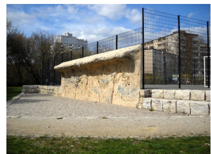
Boulderwand auf dem Jugendspielplatz