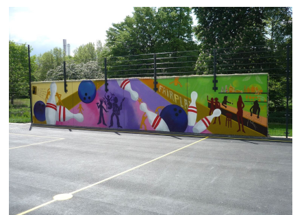
Die Rückseite der Boulderwand am Bolzplatz gestalteten Jugendliche der B.-Traven-Schule

Text u. Fotos: S.T.E.R.N. GmbH, bearb. A. Stahl, Foto 2: Planergemeinschaft Kohlbrenner eG Stand: Mai 2024