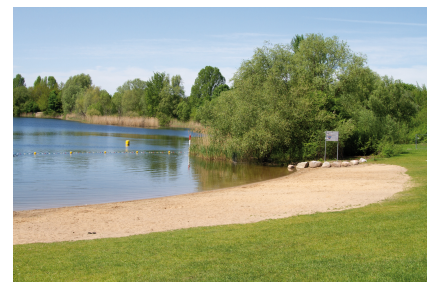
Die Badestelle ist nun gesichert und neu gestaltet