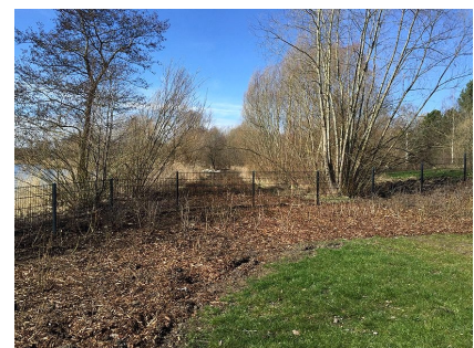
Ein Zaun beschränkt den Zugang zum Ufer