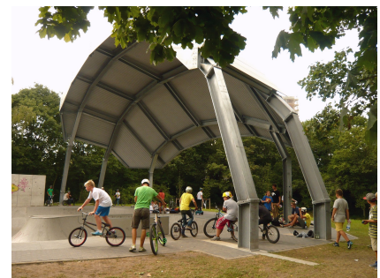
Die überdachte BMX-Anlage