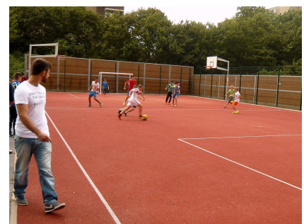
Auch der Bolzplatz wird gut angenommen