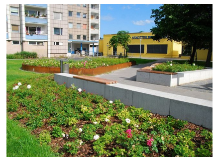
Der Rosengarten mit dem Zugang zur Stadtteilbibliothek