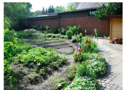
Der Gemeinschaftsgarten liegt an der Rückseite des Gemeindehauses