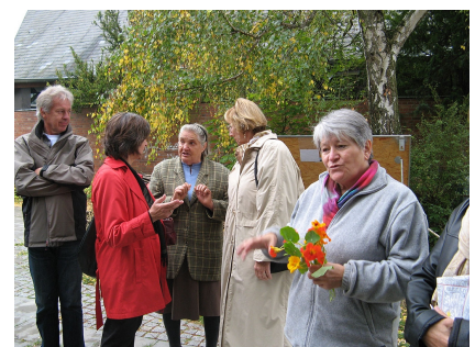
Die aktiven Gärtnerinnen stellen ihren Garten vor