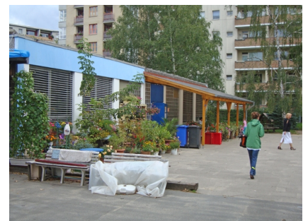
Das Gebäude vor der Sanierung