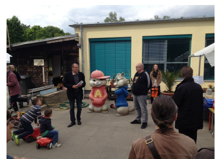
Das Fest zur Wiedereröffnung am 10. Mai 2014