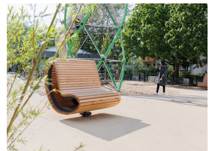
Großer Kletterturm und gemütliche, drehbare Sonnensessel