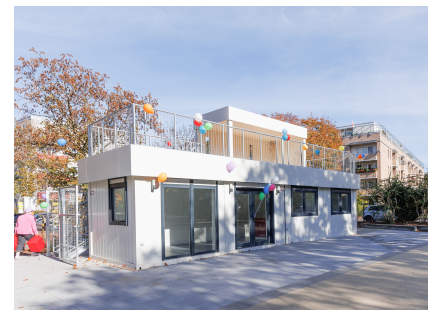
Der winterfeste Container für das Mädchenprojekt "Jackie"