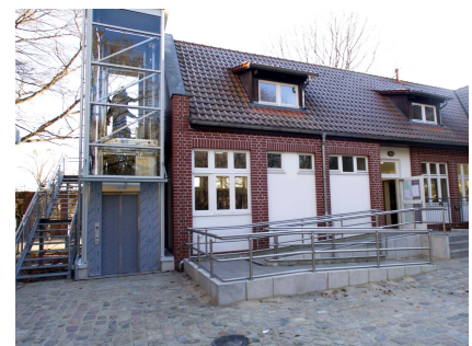
Das Familienzentrum erhielt einen Aufzug und barrierefreie Zugänge