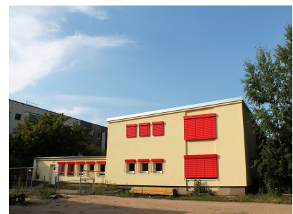
Der sanierte Südwestgiebel mit Sonnenschutz