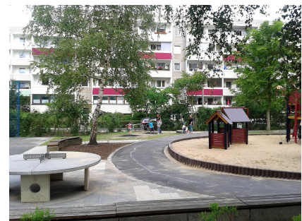
Mit der runden Tischtennisplatte wird auch an die Größeren gedacht