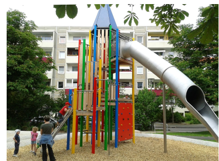
Der neue Kletter- und Rutschenturm