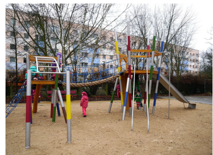
Die neue Kletterkombination im Mikadostil