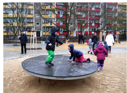
Die Drehscheibe war ein besonderer Wunsch der Kinder