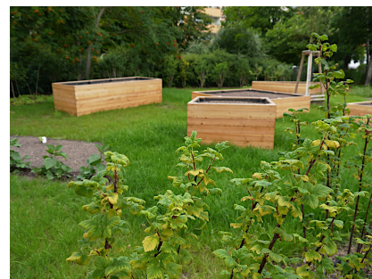
Neben einem Wasserspielplatz gibt es auch einen Naschgarten und Hochbeete