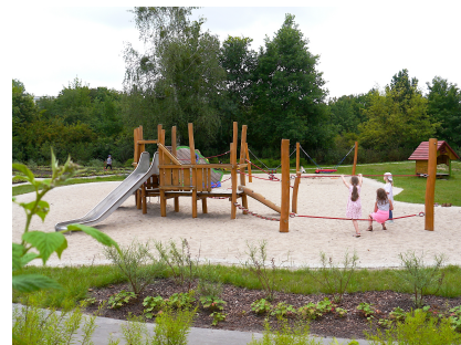
Der Spielgarten ist fertig