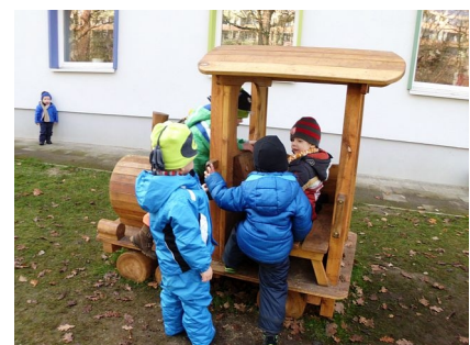
Die Eisenbahn im Kleinkinderbereich