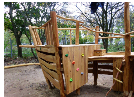
Detail des neuen Spielschiffes