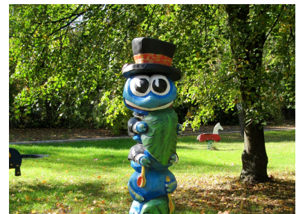
Die namensgebende "Kleine Raupe Nimmersatt" aus dem Kinderbuch von Eric Carle