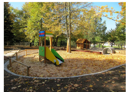
Ein Bereich für die Kleinsten