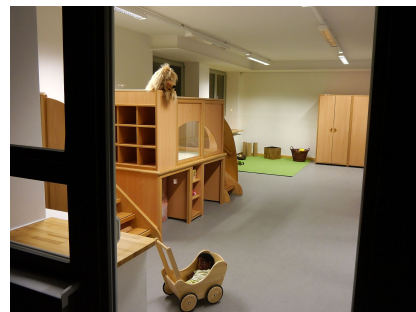
Die Gruppenräume sind funktional ausgestattet