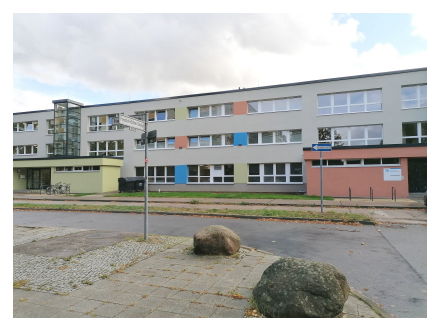
Das langgestreckte Gebäude verfügt über zwei Aufzüge