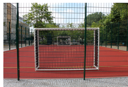
Seit 2013 gibt es einen Ballspielplatz