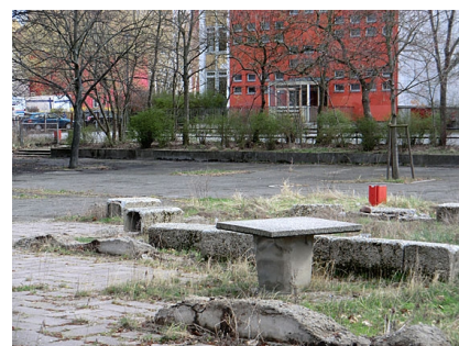
Der desolate Schulhof 2012