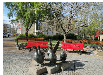
Die Gänseplastik auf dem Schmuckplatz mit vielen Bänken