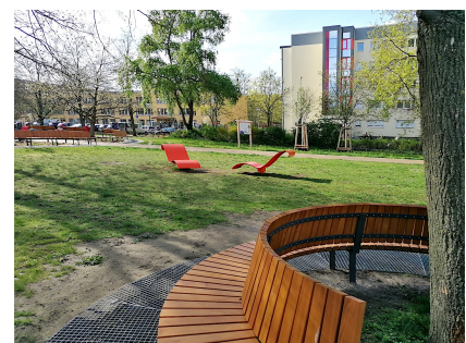
Auch auf der Wiese kann man im Schatten oder in der Sonne entspannen