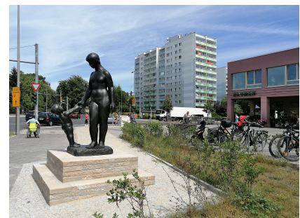
Die Skulptur "Mutter und Kind" wurde saniert und erhielt einen neuen Sockel