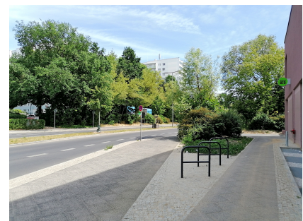
Neben Fahrradbügeln sind auch Gehölze Teil der Promenade