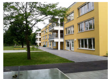
Nach der Fertigstellung