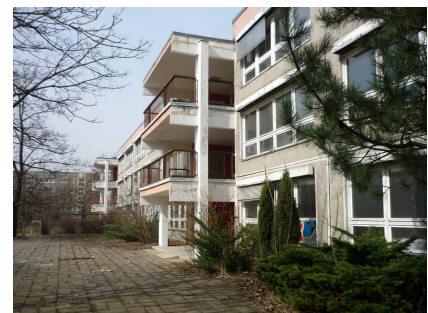
Die Gartenseite vor dem Umbau