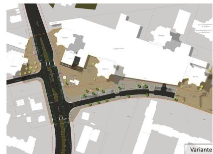
Die Vorzugsvariante ist Ergebnis der Machbarkeitsstudie des Büros "stadtraum"