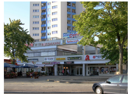
Vorplatz, Eingangsbereich und Straßenräume am Staaken-Center sollen umgestaltet werden