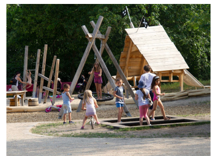
Piratenspielfeld mit Trampolin - alles ist erlaubt